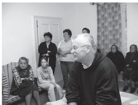
Mikóházi csendesnapon (2007)