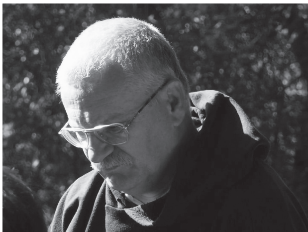
Mikóházi csendesnapon (2007)