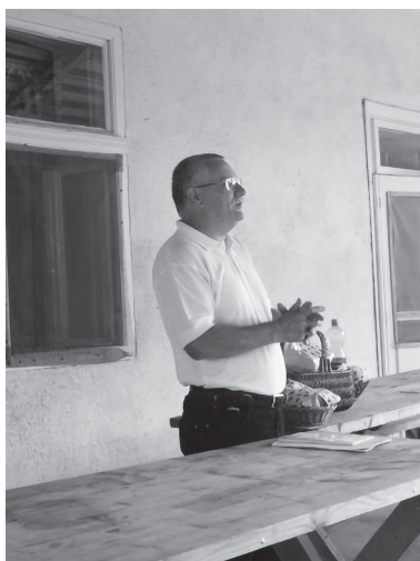
Mikóházi csendesnapon (2007)